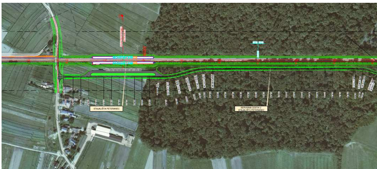
Slika 4: Stajalište s parkingom "Peteranec"- izvadak iz Idejnog projekta, URS i IDOM