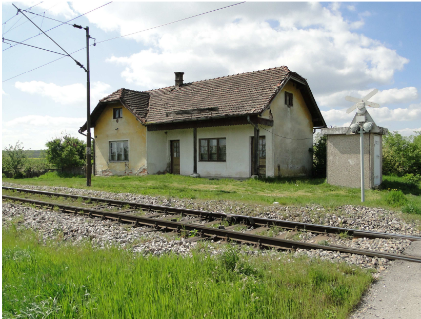
Slika 1: Napuštena željeznička stanica Peteranec